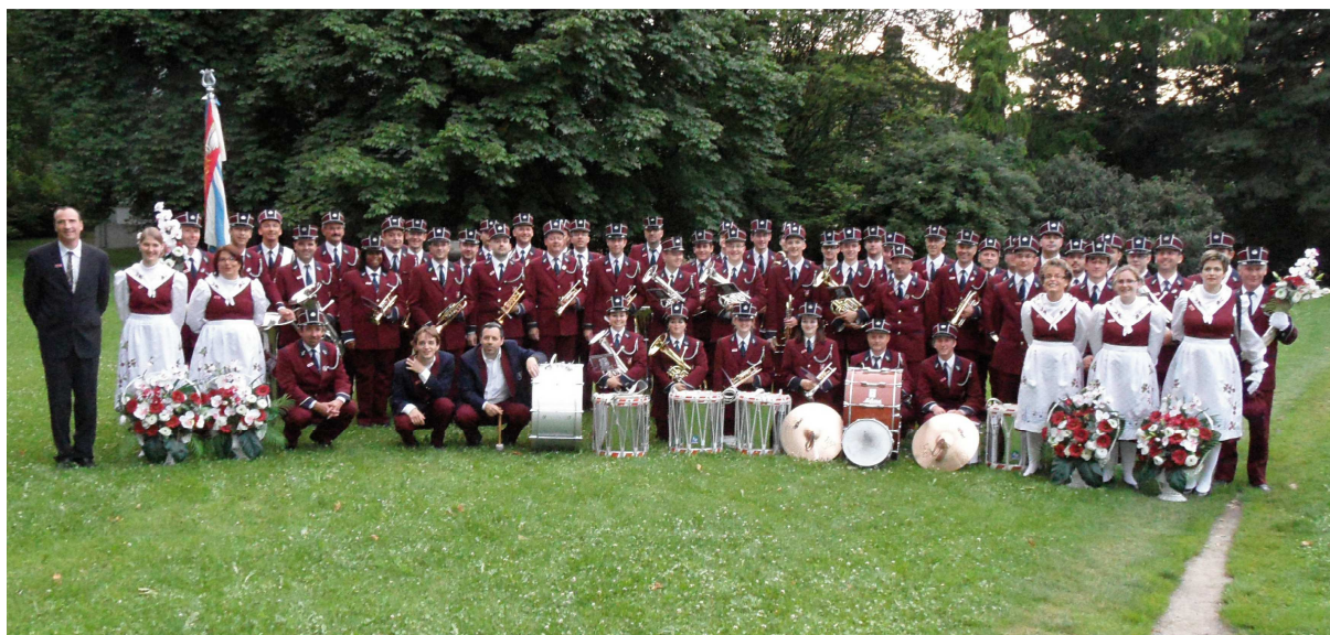
Photo : souvenirs de St-Gall sitôt le défilé terminé....